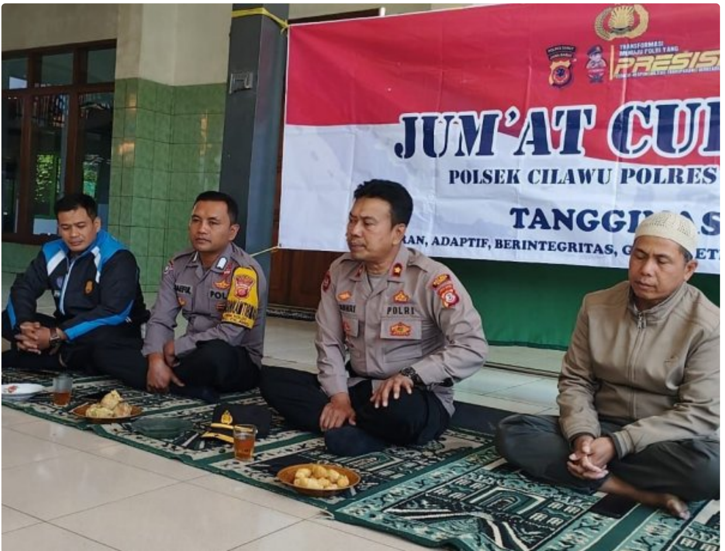
Kapolsek Cilawu mendengarkan curhatan warga